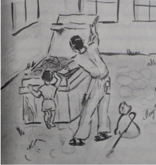
Figura 3 – Homem e criança

Fonte: O diário de Mary Berg (2010, p. 145).