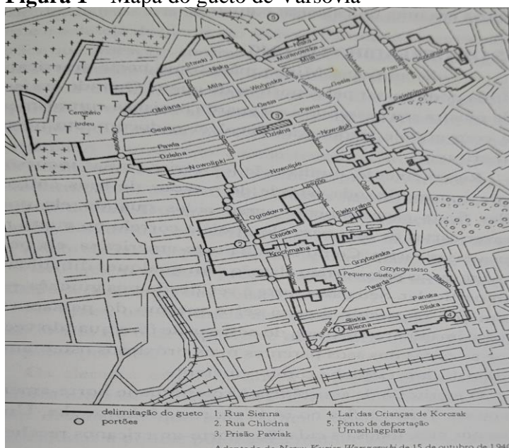
Figura 1 – Mapa do gueto de Varsóvia