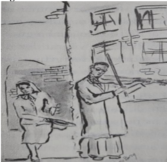
Figura 2 – Artista na rua