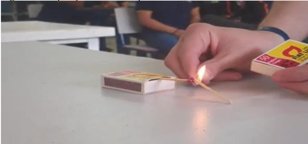
Figura 2 - Preparação inicial do experimento

A segunda etapa envolveu experimentação prática, utilizando fósforos, caixas de apoio e outros materiais de baixo custo, visando tornar o aprendizado acessível, seguro e contextualizado. Os estudantes foram orientados a observar interações entre objetos, registrar observações, propor hipóteses e discutir resultados em grupos (Santos; Silva, 2021; Santos et al. , 2022).